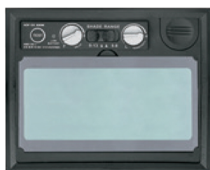
Perillas para ajuste de sensibilidad y retardo en panel digital