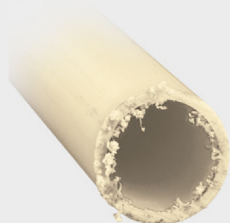
Corte con segueta