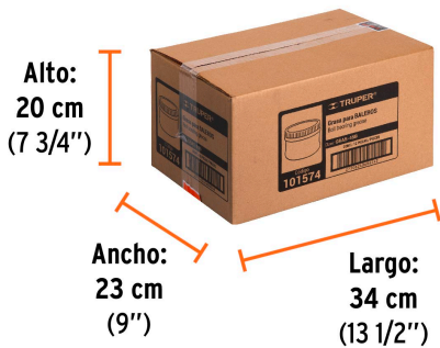
Contiene: 3 inner (12 piezas)