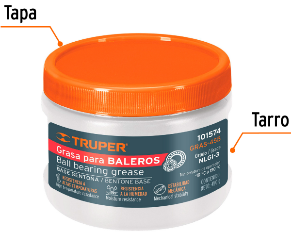
Contenido 450 g