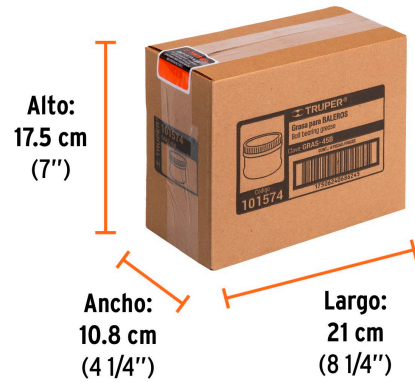
Contiene: 4 piezas