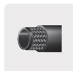
Manguera reforzada trenzada, 3 capas